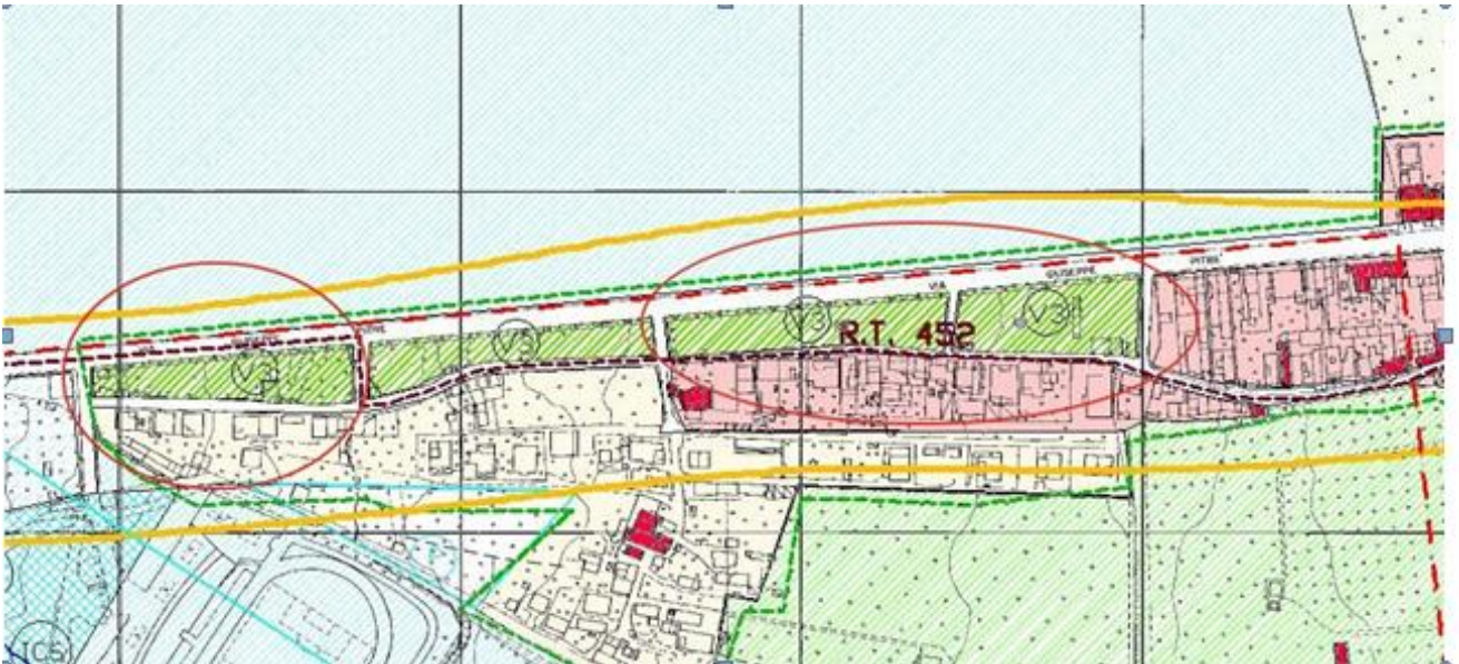
Immagine 3: destinazioni d'uso proposte per l'area di Boccadifalco – Altarello di Baida (Estratto dalla tav. 5010 del PRG vigente).