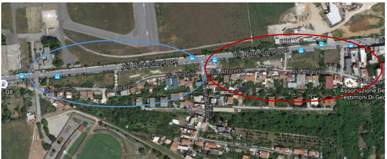
Immagine 1: foto satellitare dell'area Boccadifalco – Altarello di Baida.

L'acquisizione e il successivo utilizzo per finalità collettive delle tre aree indicate, possono ottenersi senza il ricorso allo strumento dell'esproprio in quanto tutte di proprietà del Demanio. Infine, si sottolinea come la destinazione) dell'intera superficie di queste aree, oltre a rendere un servizio ai cittadini di questa parte di città che, se si esclude il piccolo lembo sino ad ora recuperato dal Comune, non hanno altri luoghi di diletto, consentirebbe non solo di trasformare l'attuale grande aiuola attrezzata in un vero e proprio giardino, ma anche di recuperare un piccolo edificio ottocentesco posto, insieme ad una cappella dedicata a San Giuseppe, nel suo spigolo sud-occidentale, che costituiva uno dei posti di guardia della cinta daziaria di Palermo.