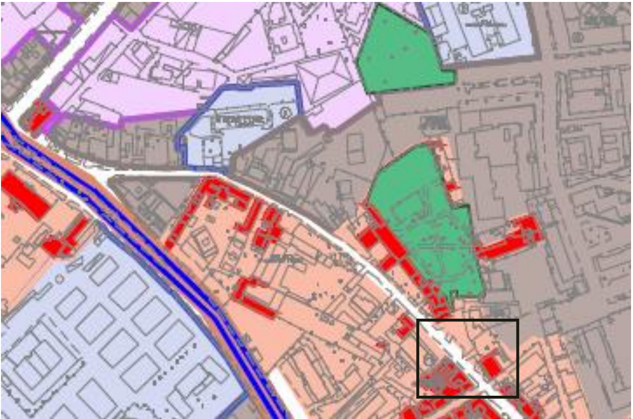
Immagine 2: previsioni di destinazioni d'uso dello schema di massima per l'area compresa tra via San Lorenzo e viale Strasburgo.