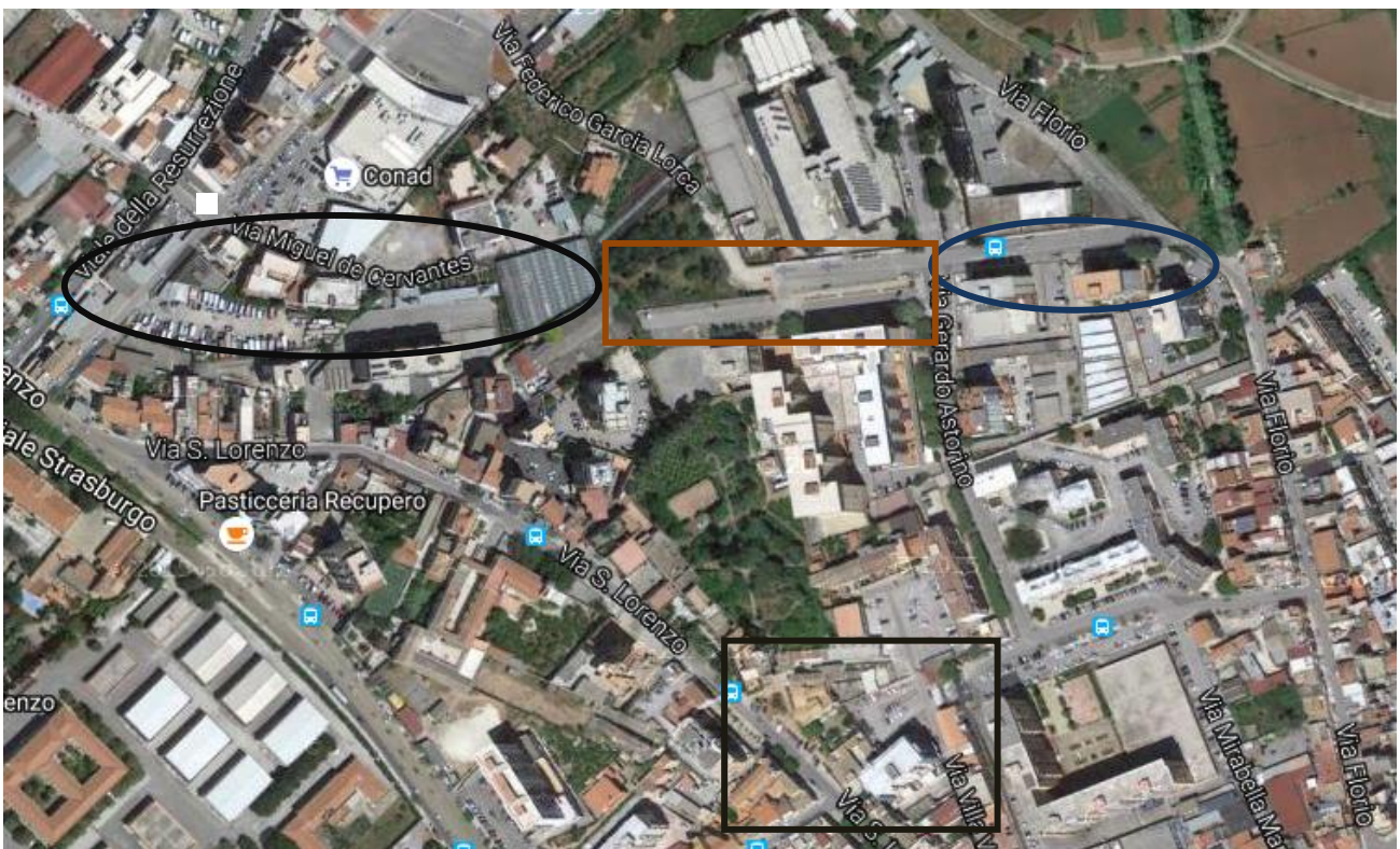
Immagine n. 3. Foto aerea dell'area sulla quale insistono villa Savona, la Casena Nicosia e la chiesa normanna di San Lorenzo (rettangolo nero). Via Domino (ellisse blu), via Fattori (rettangolo marrone) e via De Cervantes (ellisse nera).