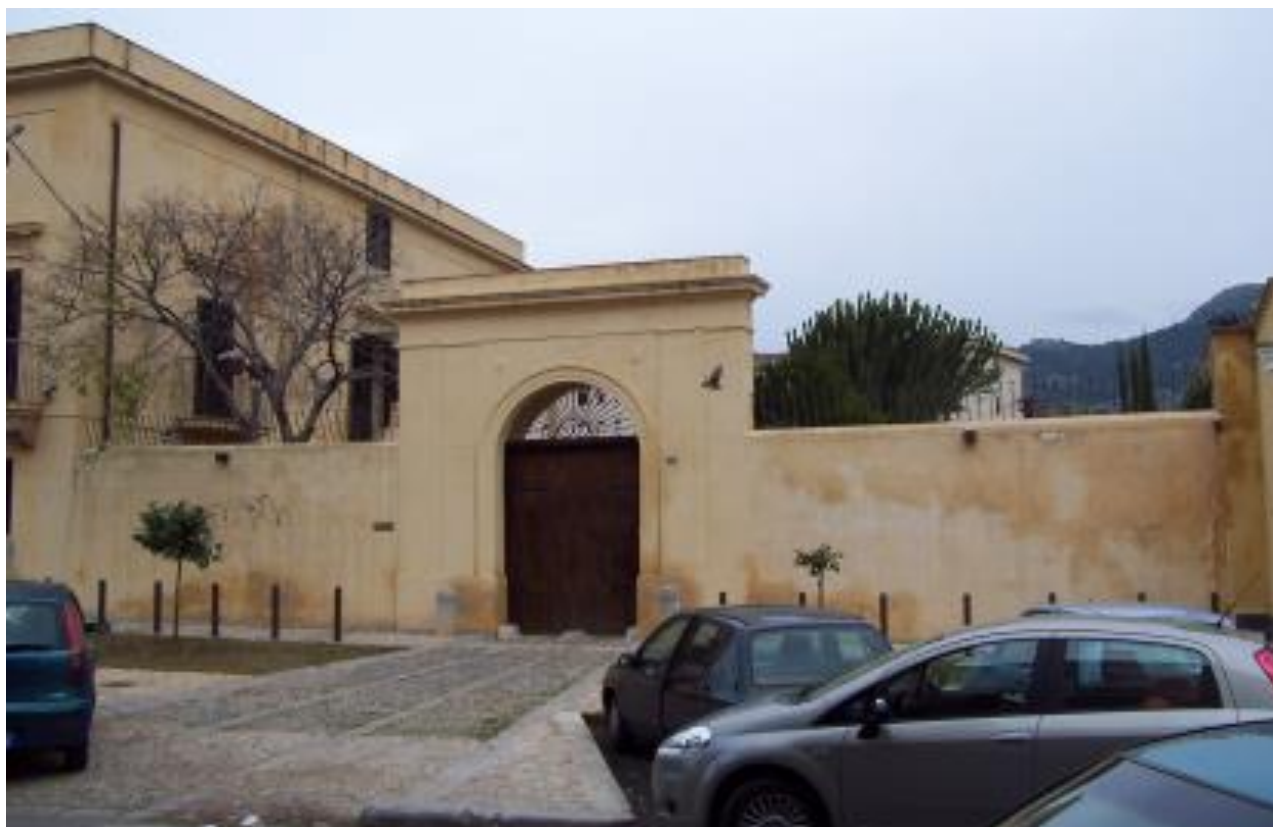
Foto n. 1: il portale della Casena Nicosia e l'antistante piazzetta sulla via San Lorenzo.

Immagine n. 3: proposta per la viabilità e le destinazioni d'uso per l'area compresa tra via San Lorenzo e viale Strasburgo: nell'ellisse in alto, la nuova strada, prolungamento delle vie Domino e Fattori che si connette direttamente su viale Resurrezione; In basso la tutela del sistema integrato di ville antiche e dei relativi cortili e viali.